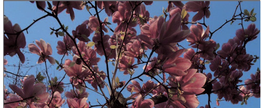
Fairmont Montreux Palace - Suisse